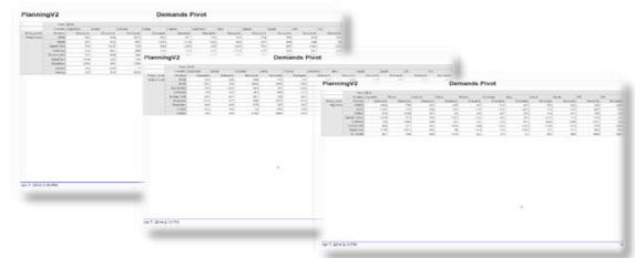
Seitenorientierter Default Report